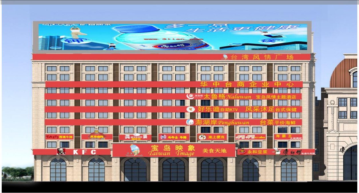
“武漢台灣風情廣場” 位置 及 外觀效果圖