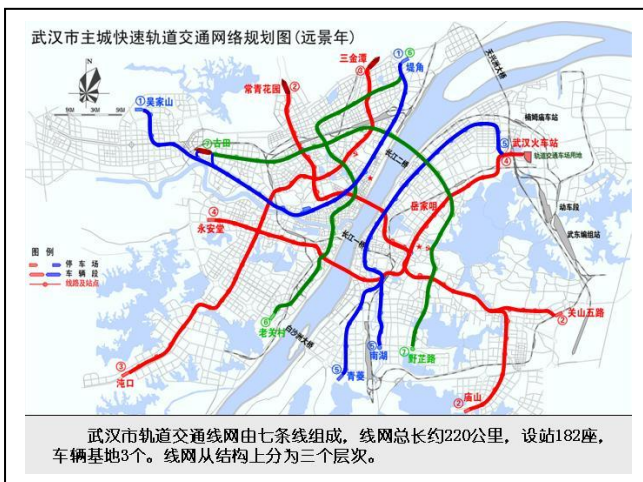
武汉市轨道交通网络由七条线组成，线网总长约220公里，设站182座，车辆基地3个。线网从结构上分为三个层次。