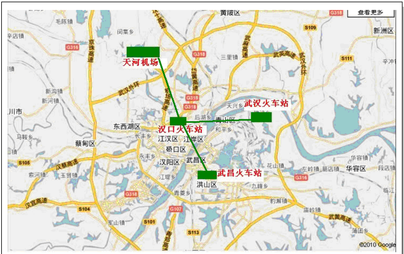
漢口火車站(武漢台灣風情廣場)距武昌、武漢火車站及武漢天河機場均約 30 分鐘