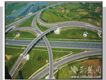
1. 京珠、滬蓉武漢戶通